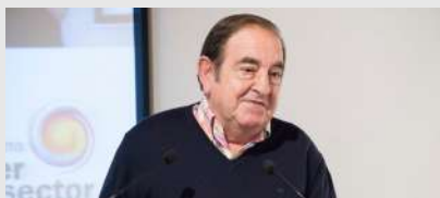
Asistencia de la Plataforma del Tercer Sector de La Rioja a la Asamblea de la PTS estatal