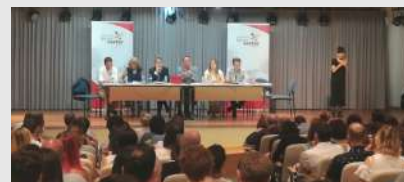
Jornada formativa sobre subvenciones con cargo al IRPF de la Plataforma del Tercer Sector de la Comunidad de Madrid