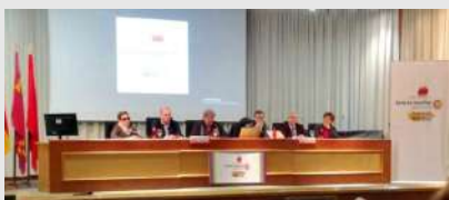
Jornada sobre la Ley de Servicios Sociales de la Plataforma del Tercer Sector de la Región de Murcia