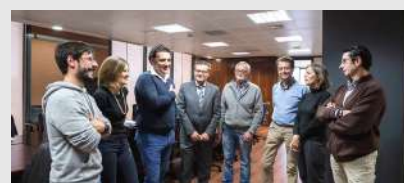
Junta Directiva de la Plataforma del Tercer Sector de Aragón