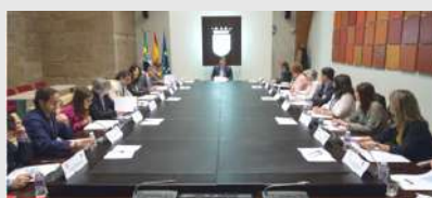
Reunión de la Mesa de Diálogo Civil con la Plataforma del Tercer Sector de Extremadura