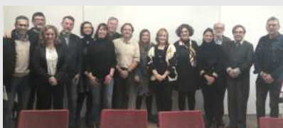
Reunión de la Mesa del Tercer Sector en el Principado de Asturias con los Grupos Parlamentarios de la región