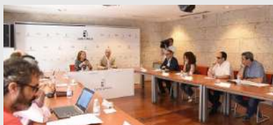
Comisión Mixta del Tercer Sector Social con la Mesa del Tercer Sector de Castilla-La Mancha