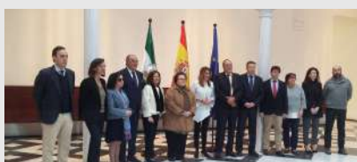
Reunión de la Mesa del Tercer Sector de Andalucía con la presidenta de la Junta de Andalucía

Las mesas y plataformas territoriales del Tercer Sector llevaron a cabo diferentes actuaciones en materia de interlocución e incidencia, impulso de derechos y alianzas con otros sectores. Cabe destacar: