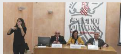
Seminario sobre "La Reforma Social de la Constitución Española" de la Plataforma del Tercer Sector de lo Social de la Comunidad Valenciana